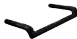
Form A in schwarz