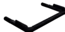
Form B in schwarz